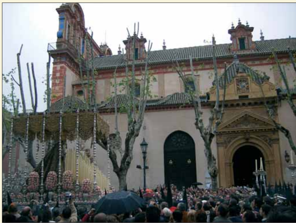
La Virgen del Patrocinio momentos antes de refugiarse en la Parroquia de la Magdalena el pasado Viernes Santo.