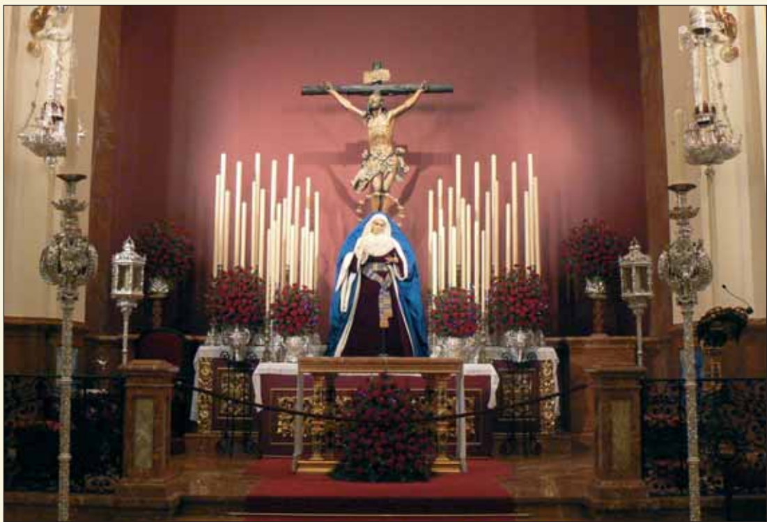
Altar de Quinario en el recientemente remozado Templo.