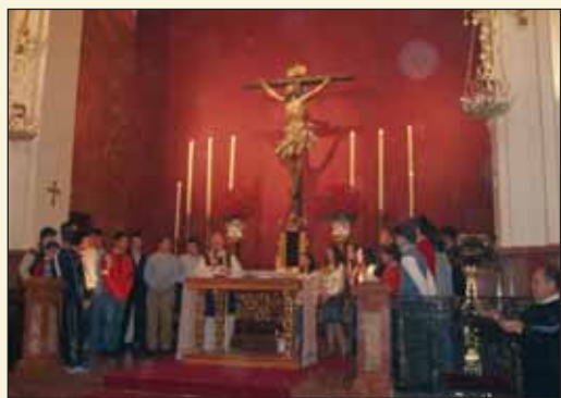
Renovación del juramento de las Reglas de la Hermandad, por parte de los hermanos que cumplen los catorce años de edad.