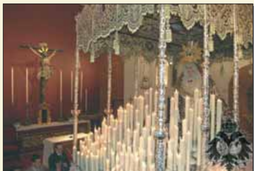
Tras su coronación canónica, María Santísima de la O recorrió las calles de la feligresía, haciendo estación en nuestro templo.