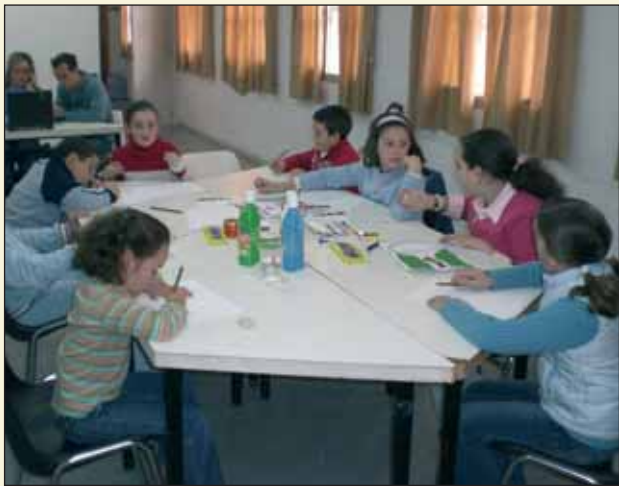
Dentro de las actividades programadas en la Semana Cultural de la Juventud, tuvo lugar un concurso de pintura entre los más pequeños de nuestros hermanos.