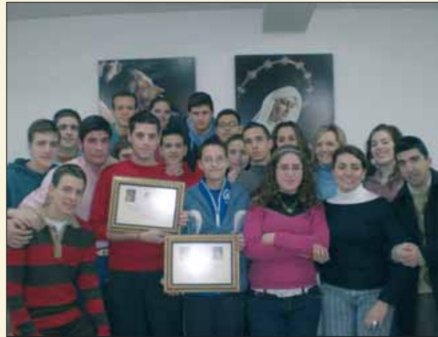
Concurso de cultura cofrade en la Semana Cultural del Grupo Joven.