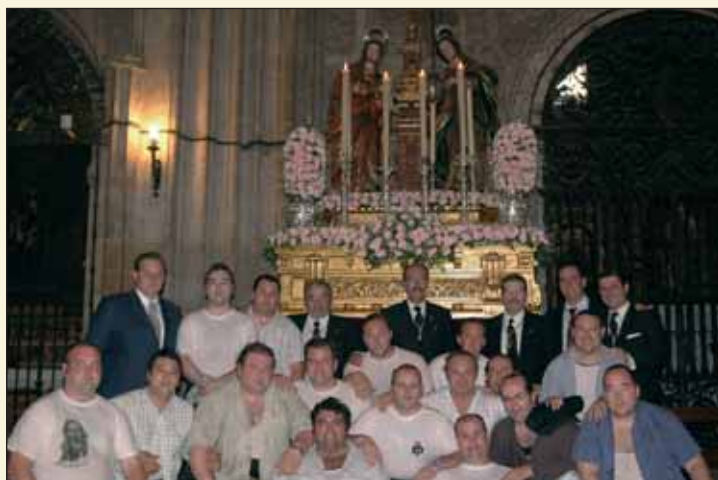
Este año correspondió a nuestra Hermandad el exorno, preparación y salida del paso de las Santas Justa y Rufina en la procesión del Corpus de Sevilla.