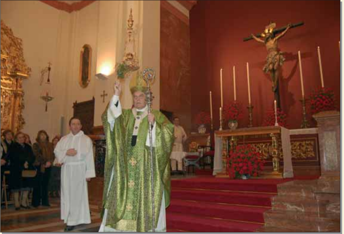
La reapertura del Templo tras las obras de reforma estuvo presidida por S.E.R. el Cardenal de Sevilla, el día 11 de febrero.