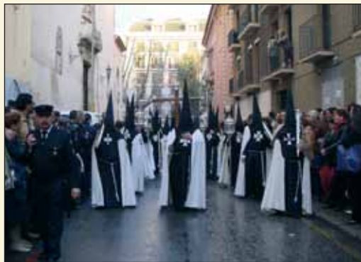
La Cruz de Guía abriéndose camino por la Calle Cristo del Calvario de regreso tras el refugio temporal en la Parroquia de la Magdalena el pasado Viernes Santo.