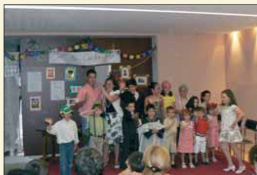
"La Foto" fue el título elegido para la representación teatral protagonizada por los más pequeños, que sirvió como clausura del curso en la Casa Hermandad.