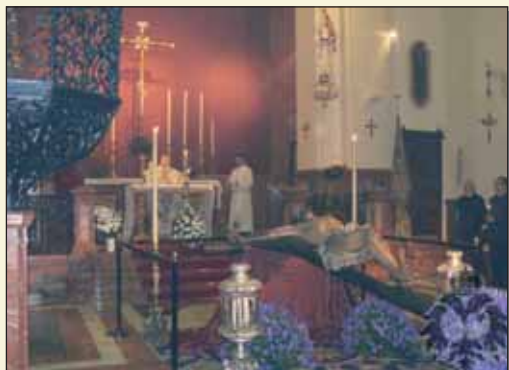
Un momento de la celebración de la Vigilia Pascual que da inicio al Solemne Besapiés del Stmo. Cristo.