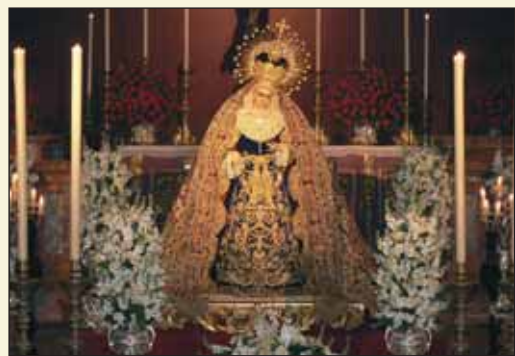
Besamanos de Ntra. Madre y Sra. del Patrocinio, el Domingo de Pasión.