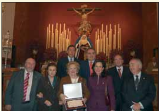
Los hermanos que cumplían sus bodas de Platino y Oro con la Hermandad fueron homenajeados durante la Función Principal de Instituto.