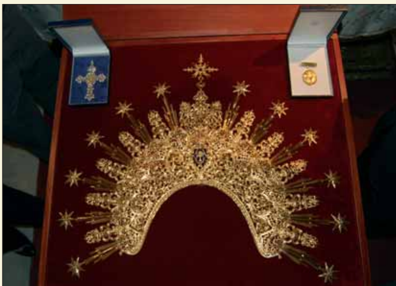
Con motivo de la Coronación Canónica de la Virgen de la O, la Hermandad regaló a María Santísima una cruz pectoral realizada en plata y oro. Igualmente, participamos en el regalo de las Hermandades del Viernes Santo consistente en una diadema de plata sobredorada.