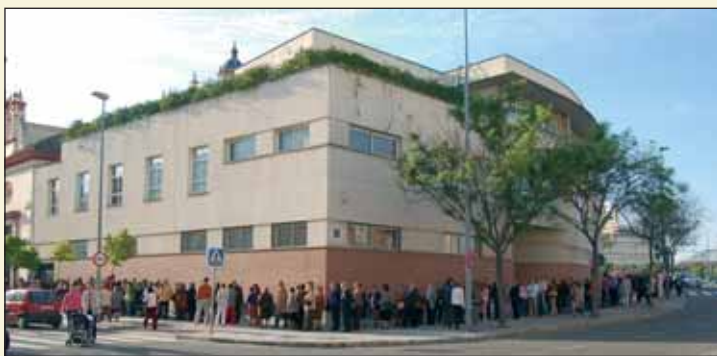
Largas colas se formaron el Domingo de Resurrección para participar un año más en el Solemne Besapiés del Stmo. Cristo de la Expiración.